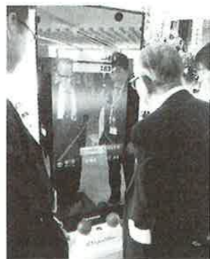
▲リハビリの評価に必要な各種測定や記録を行える

木のぬくもりを重視した。富士山や海を臨める景観をより活かす設計で建物向きを調整。微妙な角度で木を組んだため、構造計算を手掛けた設計士や建築会社には苦労をかけたが満足のいく建物ができあがったと語った。 デイサービスでは理学療法士が指導する包括的高齢者運動トレーニングを実施。介護施設では珍しいリハビリナビゲーションシステムを導入。リハナビの評価に必要な各種測定や記録を行える。継続できるように、トレーニングメニューを豊富に搭載。リハビリの評価に必要な筋力、ストレッチ、上肢可動域、バランスなど各種測定、記録を行える。