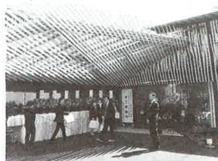
▲増築された「葉山の丘」とデイサービス「葉山の森」

既存の介護付有料老人ホーム「葉山の丘」の隣、接地に新たに2階建てのビル特化型デイサービス「ARK葉山の森」、1・2階に居室を設けた。建物内に入るとすぐに目につくのが木を格子状に組んだ本棚。階段伝いに天井近くまで本が陳列されている。照明が明るくエントランスと一体になっており、内装デザインが洗練された雰囲気を演出している。もちろん本は手に取って読むことができる。